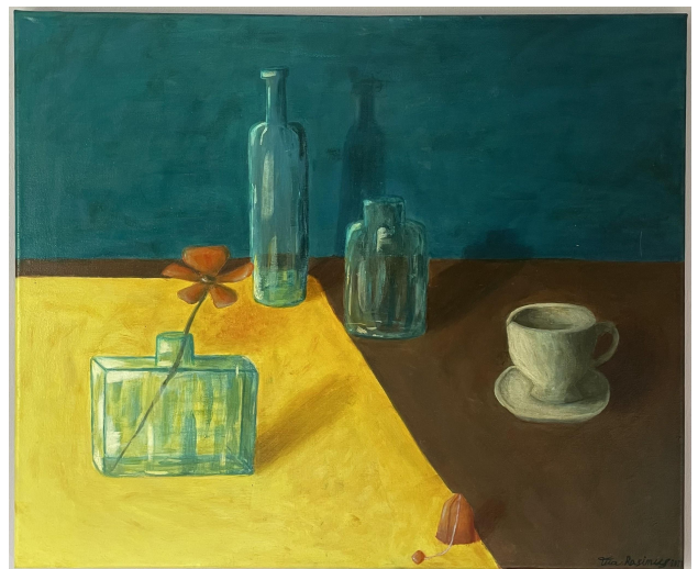
Öljyväreillä maalaamani asetelma