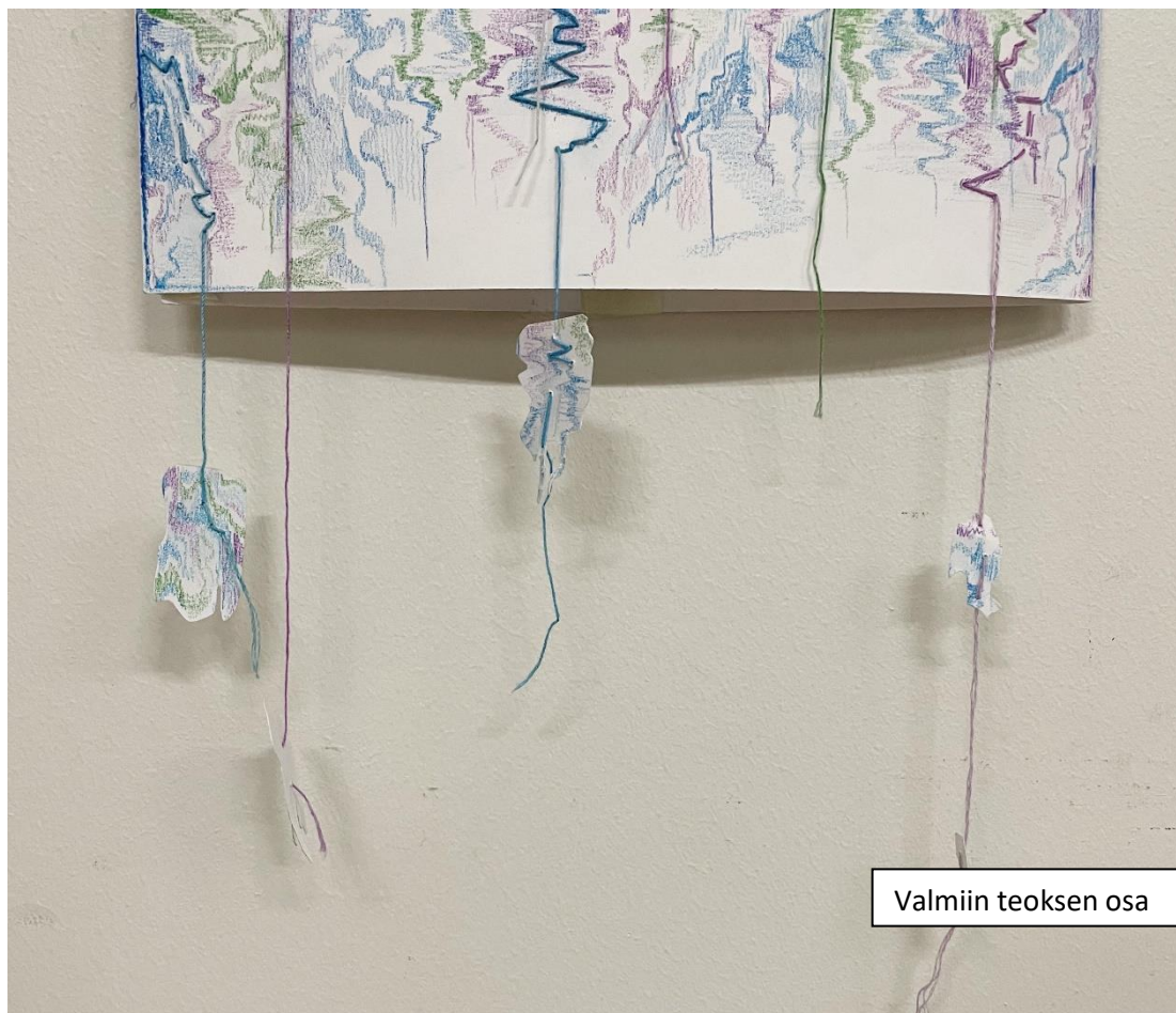
Valmiin teoksen osa